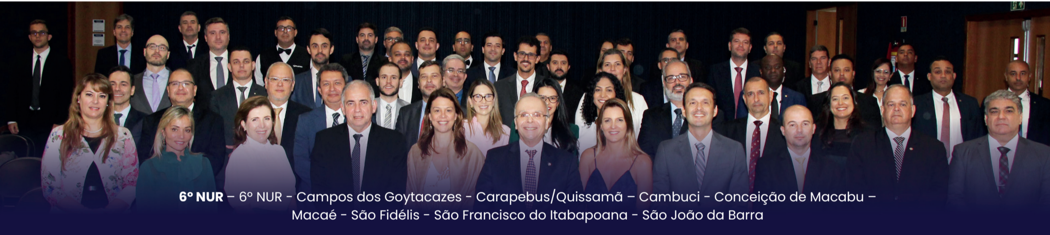
6º NUR – 6º NUR – Campos dos Goytacazes – Carapebus/Quissamã – Cambuci – Conceição de Macabu – Macaé – São Fidélis – São Francisco do Itabapoana – São João da Barra