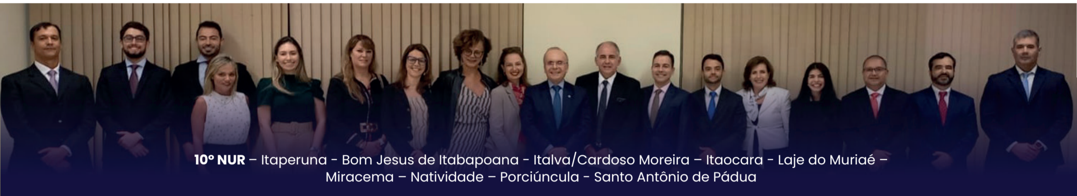
10º NUR – Itaperuna – Bom Jesus de Itabapoana – Italva/Cardoso Moreira – Itaocara – Laje do Muriaé – Miracema – Natividade – Porciúncula – Santo Antônio de Pádua

Semana 11 a 15 de setembro - Edição nº 31