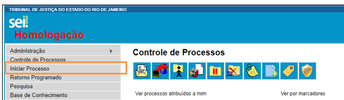
Figura 1 – Iniciar Processo.

Escolha o tipo de Processo desejado, conforme lista exibida na tela do Sistema.