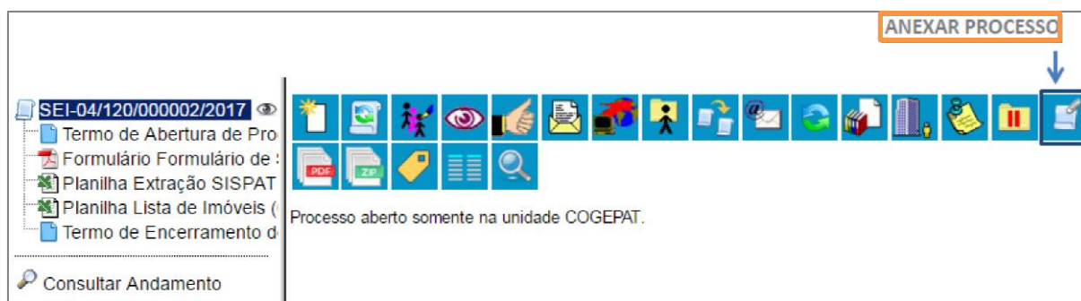
Figura 1 - Botão Anexar Processo.