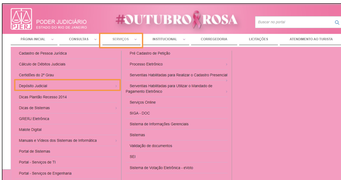
Figura 1 - Visualização Resumida.

O acesso ao sistema SISCONDJ , será através do site do TJRJ . Na página inicial do site, selecione a aba Serviços , dentre as opções listada clique em Depósito Judicial .