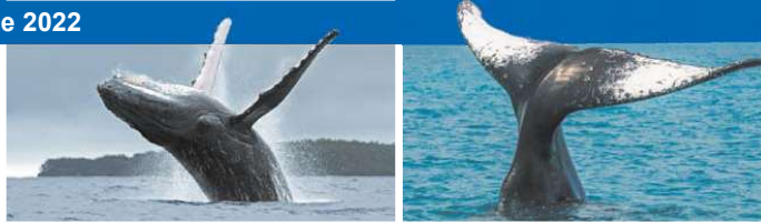
Baleia jubarte saltando e expondo sua nadadeira caudal

Há previsão de intervenções por toda a cidade. Além da realização de obras de contenção em áreas de risco em diferentes pontos, estão previstas a revitalização da Alameda São Boaventura; a expansão da malha cicloviária; a reurbanização da orla de Charitas e do Centro; assim como a construção do Novo Parque Esportivo da Concha Acústica. Também estão previstos investimentos na pavimentação e drenagem dos bairros do Engenho do Mato e do Barreto, a dragagem do Canal São Lourenço e a continuidade da obra do Parque Orla Piratininga.